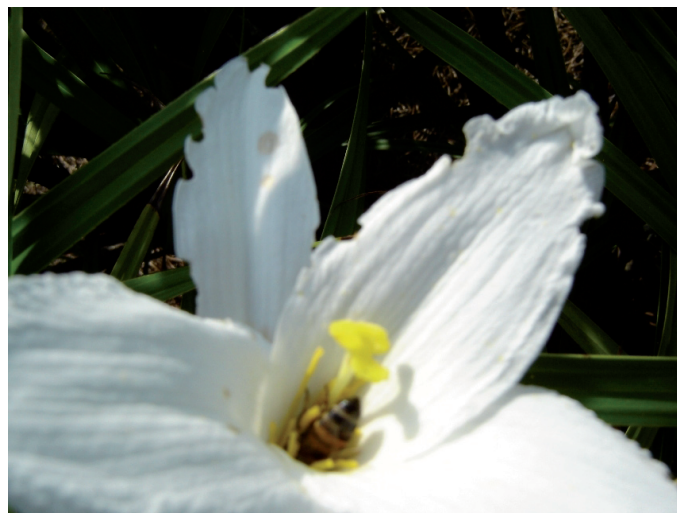
Figura 3. Visita de Apis mellifera à flor de Vellozia candida no Costão de Itacoatiara.