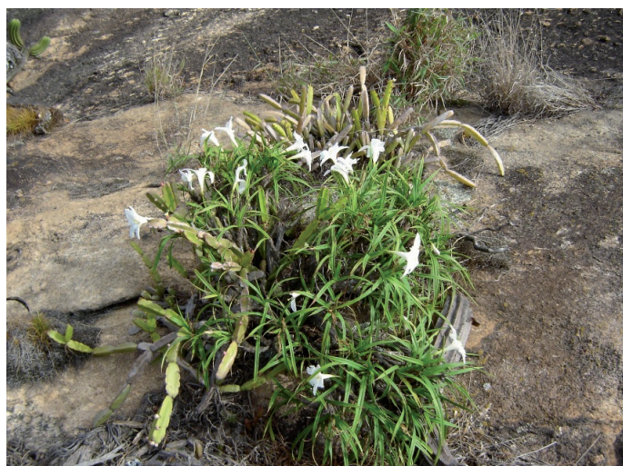
Figura 2. Vellozia candida em período de floração no Costão de Itacoatiara.