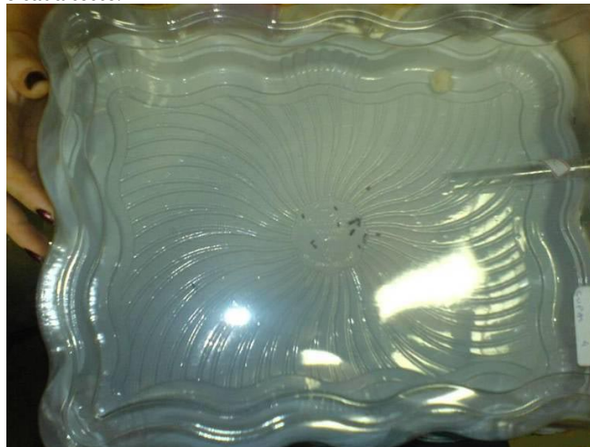
Figura 1. Arena utilizada nos testes.

As formigas foram mantidas sem alimento durante um dia antes de cada teste.