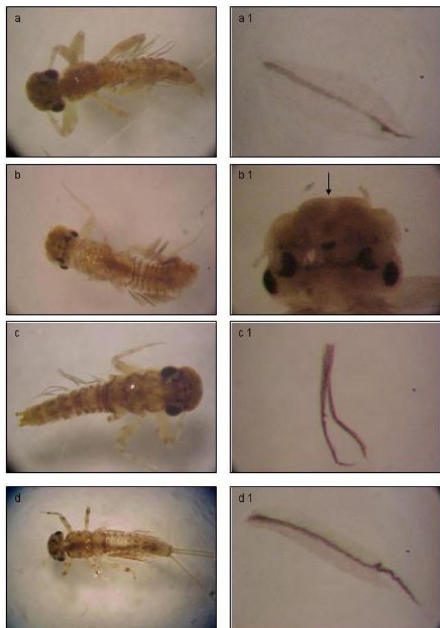
Figura 2. Gêneros e estrutura de identificação. a e a1) Farrodes e brânquea; b e b1) Thraulodes e labrum; c e c1) Hagenulopsis e brânquea; d e d1) Miroculis e brânquea.

dos indivíduos foram coletados no período seco e 32% no período chuvoso, corroborando BISPO & OLIVEIRA (1998), o qual indica que nos meses de maior pluviosidade, houve menor quantidade de indivíduos coletados. No período chuvoso se obteve menor número de indivíduos porque o substrato necessário para a manutenção da fauna foi lavado e os sedimentos, detritos vegetais e os próprios organismos carregados ( drift ), devido ao aumento da velocidade da água e da vazão. No período seco a água fica restrita ao canal principal do igarapé fornecendo substrato estável (vegetação marginal e folhiço submerso) para a manutenção da fauna.