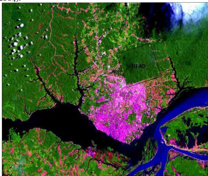
Figura 1. Mapa de localização dos igarapés da Reserva Florestal Adolpho Ducke.

Área de Estudo. O estudo foi desenvolvido em 38 igarapés das duas bacias hidrográficas localizadas a oeste (igarapés Acará e Bolívia) e a leste (igarapés Tinga, Uberê e Ipiranga) na Reserva Florestal Adolpho Ducke (Figura 1). As coletas foram realizadas com auxílio de uma rede entomológica aquática, nos períodos chuvoso (março a abril de 2004) e seco (setembro a outubro de 2004).