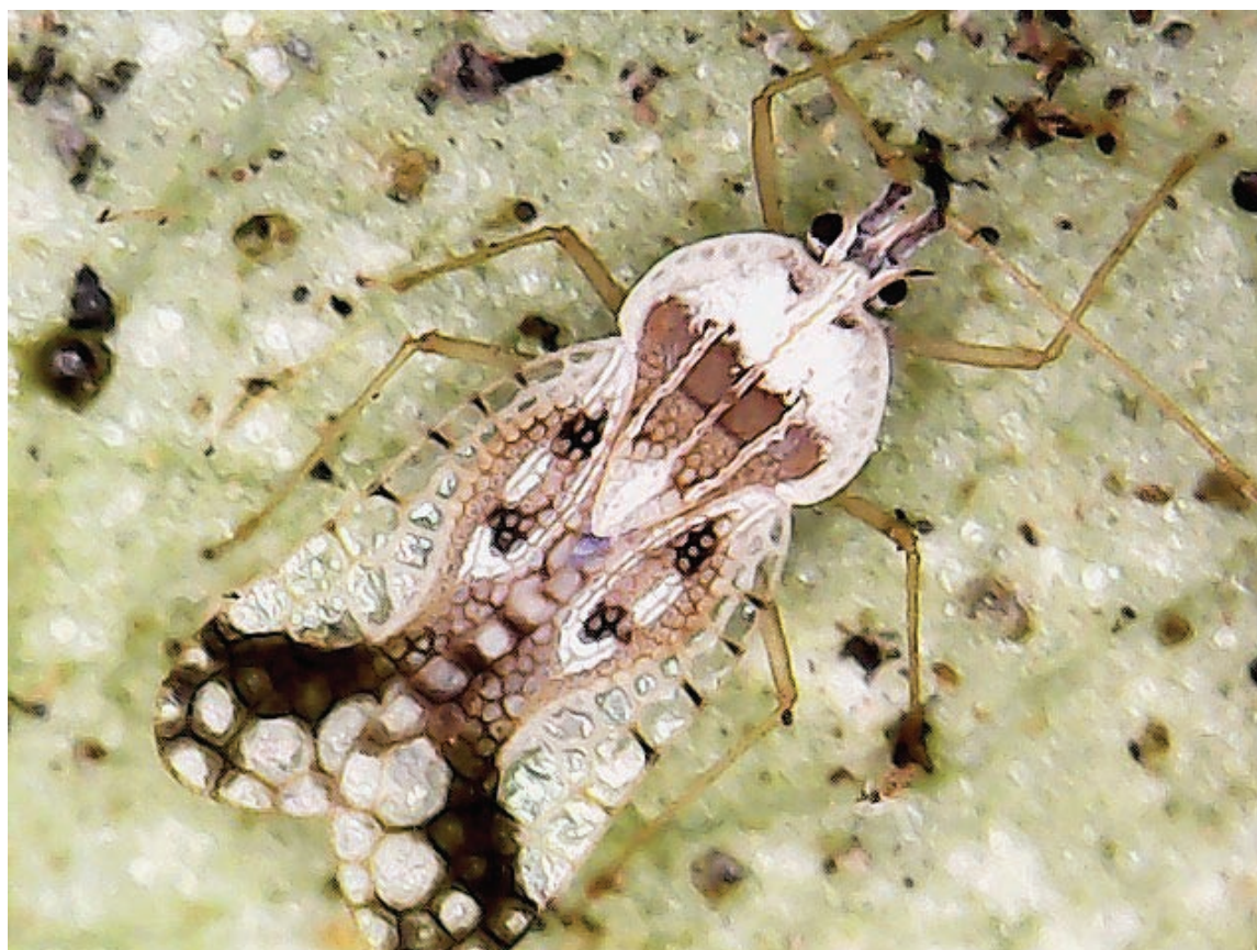
Figura 1. Gargaphia lunulata na superfície inferior de folha de feijão ( Phaseolus vulgaris L.) no estado do Tocantins.

O trabalho registra a primeira ocorrência de G. lunulata ocasionando danos em cultivos de feijão, maracujá, quiabo e em plantas daninhas conhecidas popularmente como flor-do-guarujá e fedegoso, no estado do Tocantins. Assim, realça-se a necessidade de acompanhamento e estudos que possam sugerir métodos de manejo e controle desses insetos em plantas hospedeiras, evitando surtos populacionais em áreas produtoras de feijão e soja no Estado.