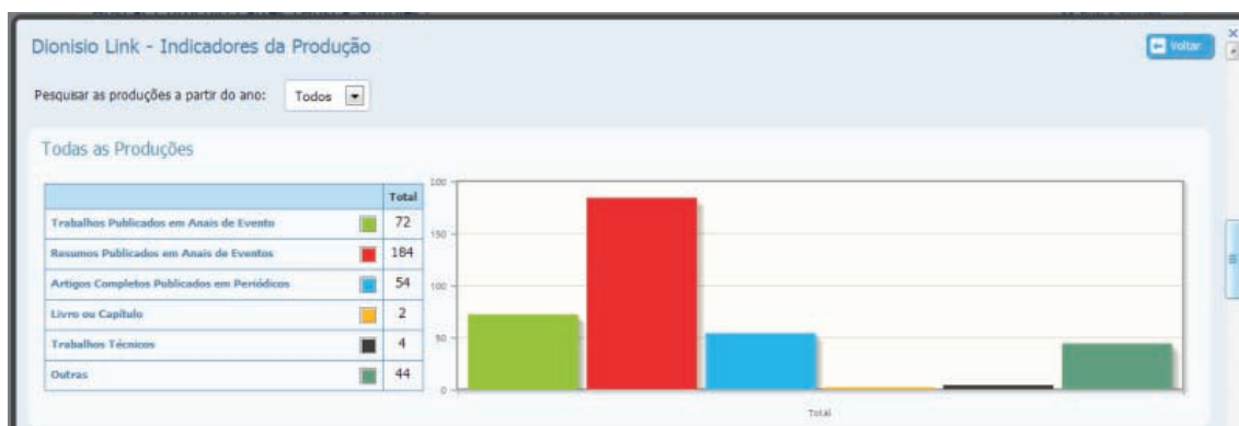
Figura 4. Produção científica do Dr. Dionisio Link por tipo de produção.