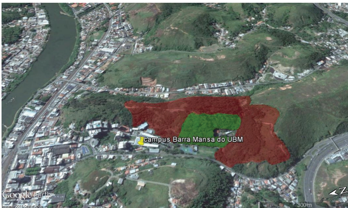
Figura 1. Delimitação espacial das áreas amostradas no campus Barra Mansa do UBM. Polígono em verde: área reflorestada; Polígono em vermelho: campo antrópico.

As buscas ativas com rede entomológica ocorreram ao longo de transectos em cada área de estudo, em dias alternados, das 8 às 12 h (totalizando 96 h/área, ou seja, duas amostras/área/mês). As armadilhas Möericke (pratos-armadilhas) foram instaladas no solo ao longo de dois transectos em cada área estudada (quatro pratos/transectos equidistantes a 5 m um do outro) ficando ativos durante sete dias consecutivos por quinzena (duas amostras/área/mês). Foram instaladas 10 armadilhas aromáticas à base de salicilato de metila em cada área, dispostas à 1,5 m de altura do solo e distanciadas a cerca de 5 m entre si. As armadilhas